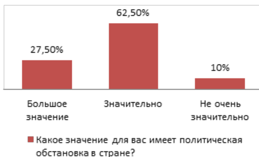
Рис. 1. Значение политической обстановки в стране

По результатам опроса выяснилось, что политическая обстановка в стране оказывает большое значение лишь для 27,5% опрошенных респондентов. Значительное – такой ответ дали 62,5% респондентов. Для 10% политическая обстановка в стране не очень значительная. Важно отметить, что на вариант ответа не значительная политическая обстановка высказалось 0 респондентов, что составляет 0%. Этот факт, к сожалению, не говорит о том, что для молодёжи первостепенное место занимает политика. Но для доминирующей части опрошенных – всё-таки политическая обстановка значительная (см. рис. 1).